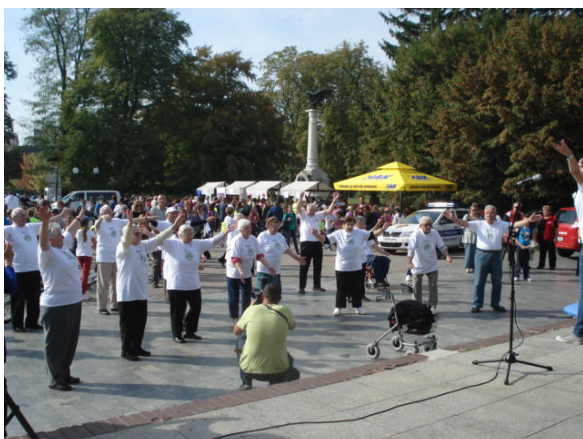
Umirovljenici stariji od 80 godina u akciji