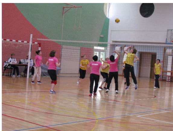
U žaru igre