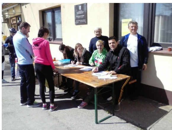
Start-prolaz, punkt u Pušćinama