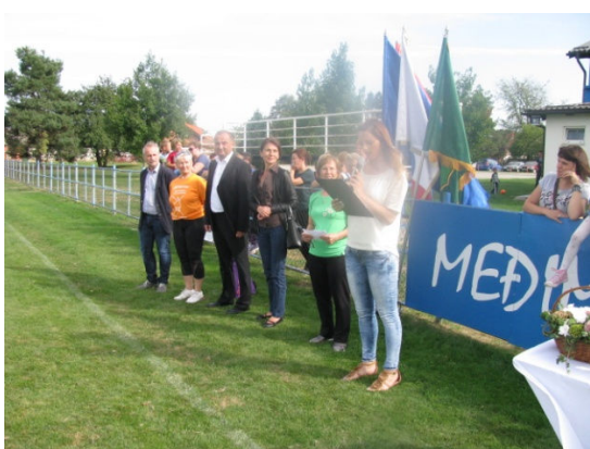
Gosti za vrijeme svečanog otvorenja