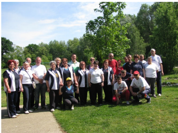
Sudionici turnira u boćanju