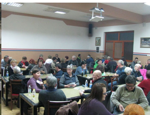
Puna sala vatrogasnog doma u Svetoj Mariji