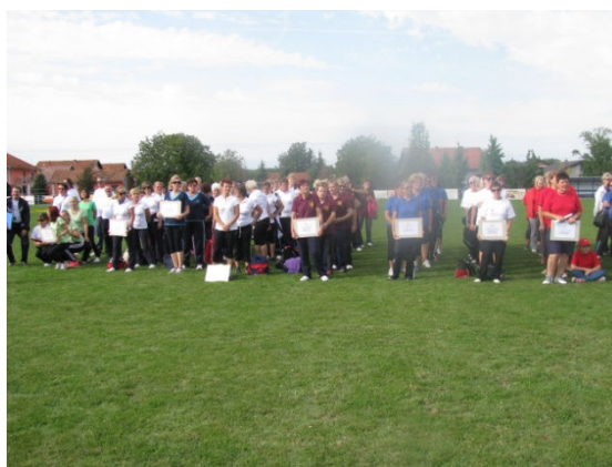
Prije početka natjecanja svečano otvorenje