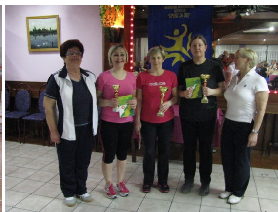
Predstavnice pobjedničkih ekipa