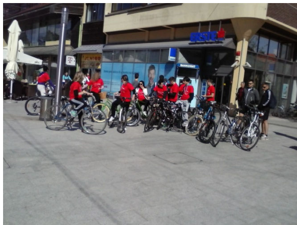
Bilo je najviše mladih