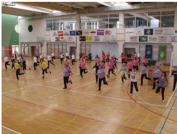
Zagrijavanje sudionika turnira u odbojci