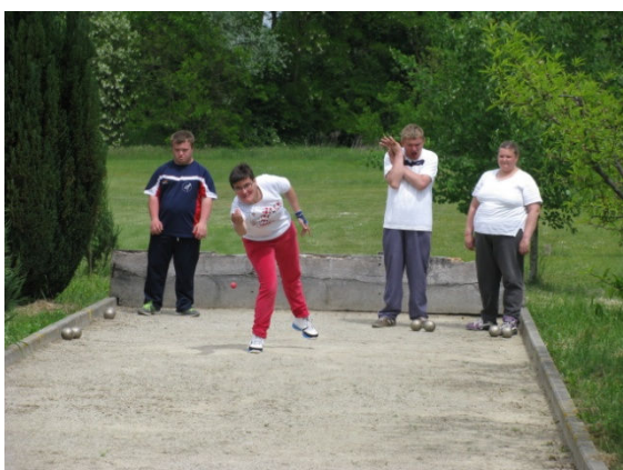
Boćari iz UOSITMŽ u akciji