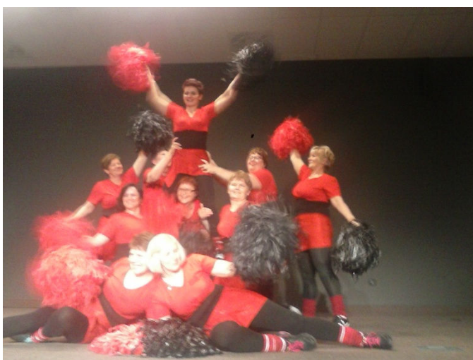
Rekreativke iz Murskog Središća u svom prekrasnom plesnom prikazu

U organizaciji Hrvatskog saveza sportske rekreacije „Sport za sve“ od 26.- 29.03.2015. g. u Lovranu je održano tradicionalno okupljanje žena na 40. ožujskim susretima žena Hrvatske. Ove godine u programu vježbanja-prikaza, sportskim natjecanjima i na zabavnom večernjem programu sudjelovalo je 100 rekreativki. U sportskim disciplinama najviše medalja osvojile su rekreativke iz Međimurja. U vrijeme susreta održan je i seminar za voditeljice aerobike i pilatesa na kojem su sudjelovale i naše voditeljice.