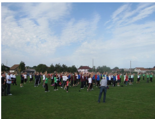
Zajedničko zagrijavanje i razgibavanje