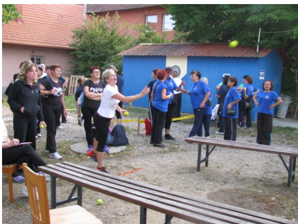
Gađanje loptice u koš