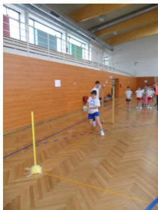
U Osnovnojškoli Belica

Obilježilo je desetak članica raznovrsnim sportsko-rekreacijskim aktivnostima (pješačenje, biciklizam, sportske igre, stolni tenis, tenis, bočanje, tjelesnim vježbanjem i sl.)