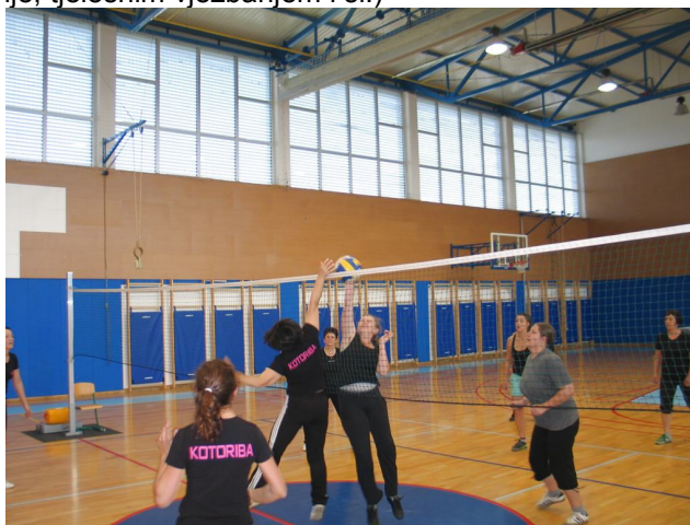
Rekreativke društva žena Kotoriba